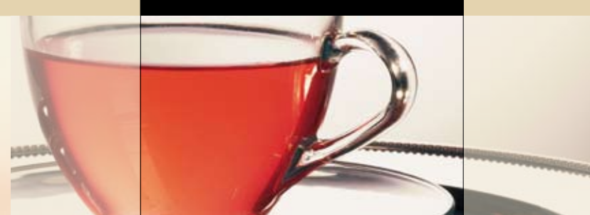
TEE . SPIRITUOSEN