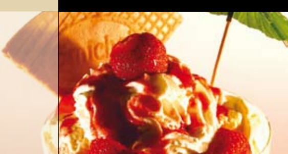
EIS . EISGETRÄNKE