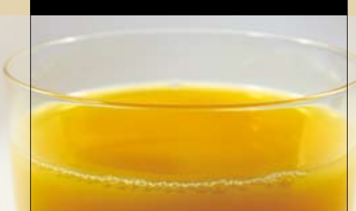
GERTRÄNKE . BIER